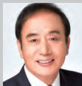
上田きよし 埼玉県選挙区(衆3期・参2期)