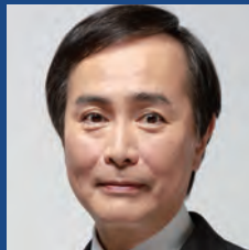
川合孝典 比例代表(3期)