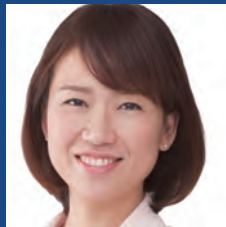
伊藤たかえ 愛知県選挙区(2期)