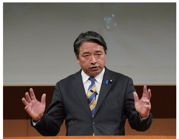
議案報告・提案を行う様葉幹事長